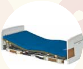
超低床介護用ベット